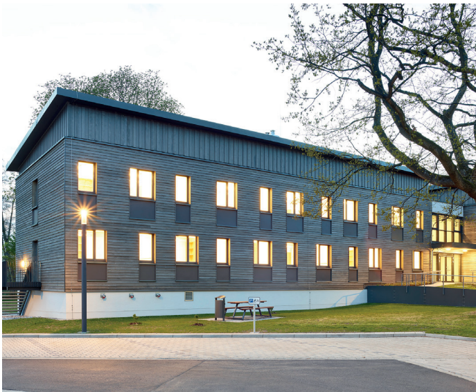
Nordwestdeutsche Forstliche Versuchsanstalt, Ersatzneubau