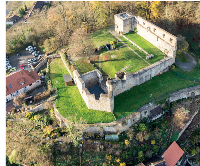
Heidenburg Einbeck Salzderhelden, restauratorische Sicherung des Natursteinbestandes