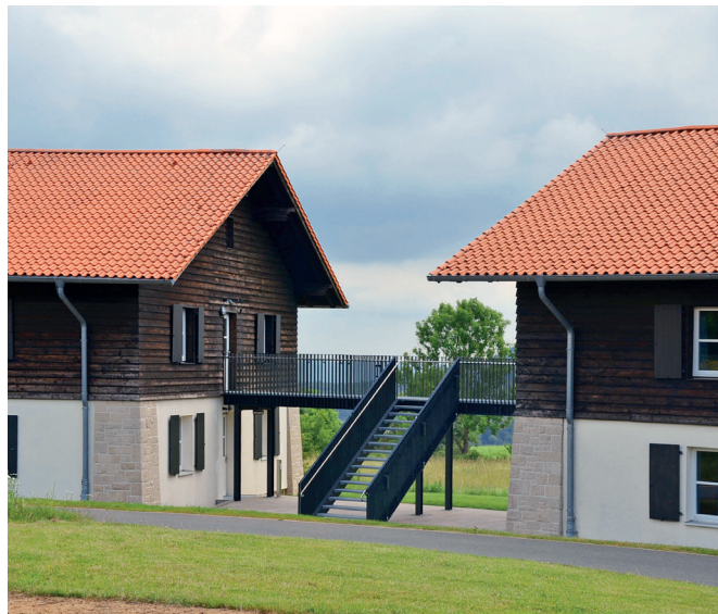
Bildungszentrum Ith, Sanierung Gebäude 10