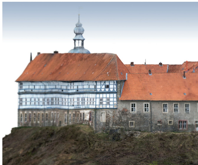
Schloss Herzberg, Fassadenansicht

Weitere Informationen unter: www.nlbl.niedersachsen.de/karriere