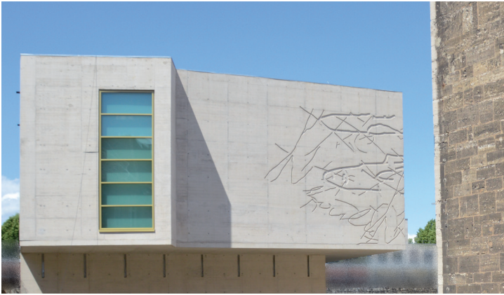
Justizvollzugsanstalt Wolfenbüttel, Neubau Gedenkstätte