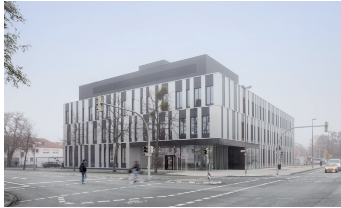
Ostfalia Hochschule, Laborgebäude für Fahrzeugtechnik, Foto: Werner Huthmacher Fotografie

Zu unseren weiteren Aufgaben zählen die Wertermittlung von Gebäuden und Grundstücken, die Prüfung von Zuwendungsanträgen und die Bearbeitung von Anfragen, wenn Träger öffentlicher Belange beteiligt sind. Außerdem kümmern wir uns um den Substanz- und Werterhalt des Gebäudebestandes und überwachen den Betrieb der technischen Anlagen in unseren Liegenschaften.