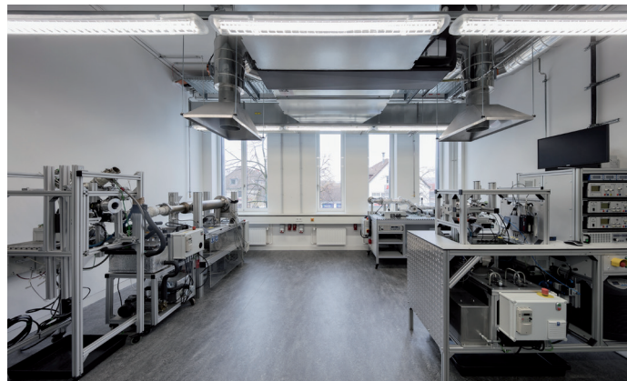
Ostfalia Hochschule, Laborgebäude für Fahrzeugtechnik, Foto: Werner Huthmacher Fotografie