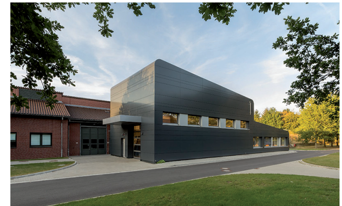
Physikalisch-Technische Bundesanstalt, Sicherheitstechnik

Sie möchten in unserem Team mitarbeiten? Dann bewerben Sie sich. Wir suchen kontinuierlich Fachkräfte aus den Bereichen Architektur, Bauingenieurwesen, Elektrotechnik, Energie- und Versorgungstechnik, Straßen- und Tiefbau, Wirtschaftsingenieurwesen und Verwaltung.