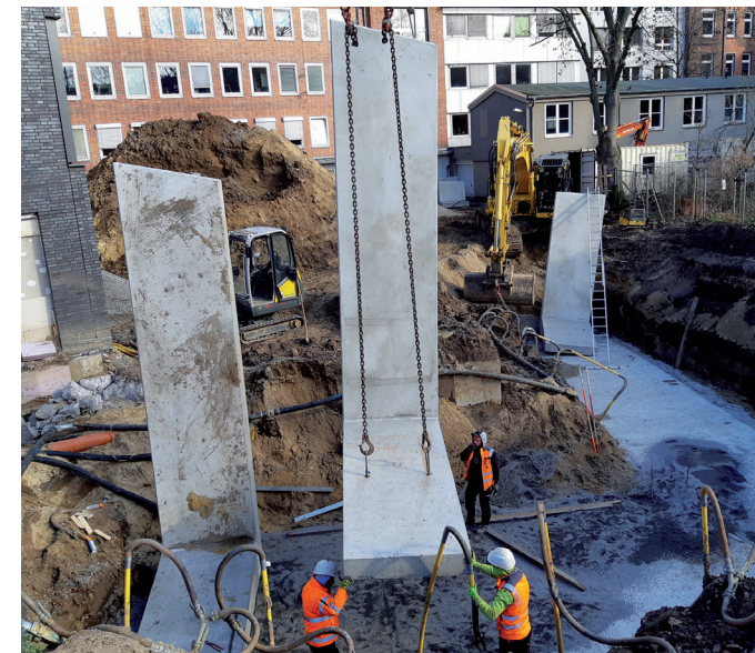
Niedersächsisches Landesgesundheitsamt: Einbau von Winkelstützen

Projektentwicklung, Projektsteuerung und Projektleitung führen wir als Bauherrnleistungen überwiegend selbst durch. Bei den Leistungen für Planung und Ausführung arbeiten wir mit unabhängigen Architektur- und Ingenieurbüros zusammen.