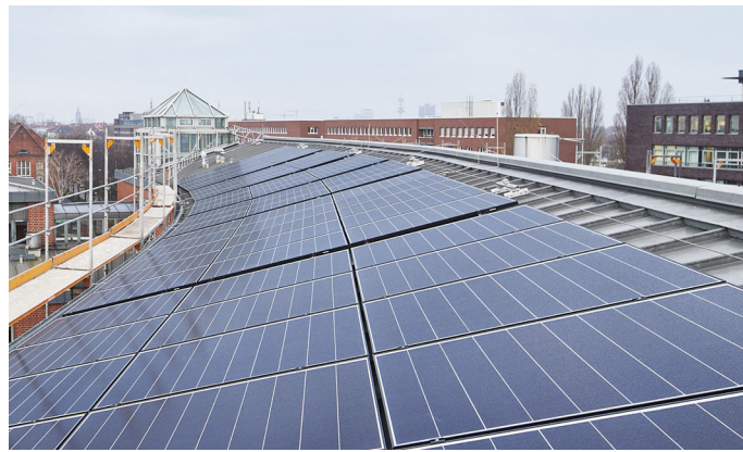
Kurt-Schumacher-Kaserne: Photovoltaikanlage

Ein weiterer Schwerpunkt ist die Unterhaltung der baulichen Anlagen. Wir kümmern uns um den Substanz- und Werterhalt des Gebäudebestands und überwachen den Betrieb der technischen Anlagen in unseren Liegenschaften. Gewähren das Land oder der Bund finanzielle Zuwendungen für Bauvorhaben privatwirtschaftlicher Dritter, sind wir für die fachliche Begleitung zuständig und prüfen die korrekte Verwendung der Fördermittel.