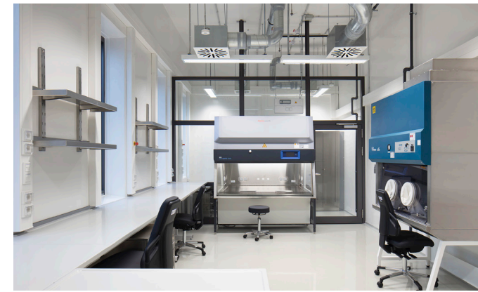
Neubau NLGA Laborbereich

Die wirtschaftliche, technische und gestalterisch anspruchsvolle Umsetzung unserer Projekte spielt als Teil der öffentlichen Baukultur für uns eine wichtige Rolle. Auch Nachhaltigkeit und ein ressourcenschonender Material- und Energieeinsatz werden bei uns großgeschrieben. Unser Anspruch ist es, unseren öffentlichen Auftrag mit großem Engagement zielgerichtet zu erfüllen.