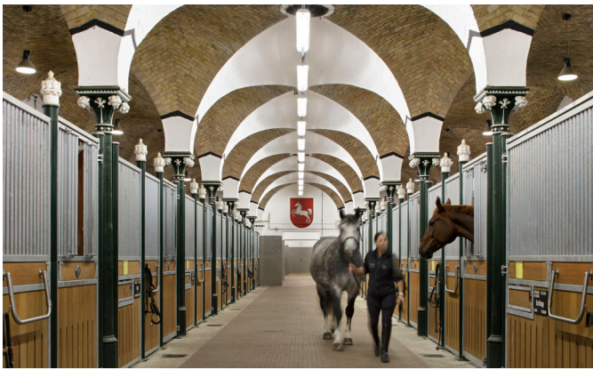
Polizeidirektion Hannover Reiterstaffel Welfenplatz