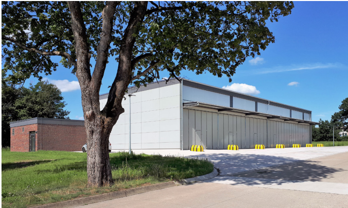
Hindenburg-Kaserne Münster, Neubau Wartungs- und Ausbildungshalle für das Drohnensystem KZO