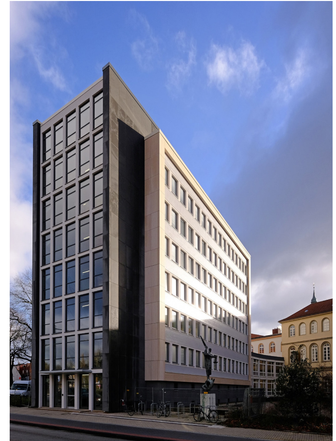
Oberlandesgericht Celle, Fassadensanierung