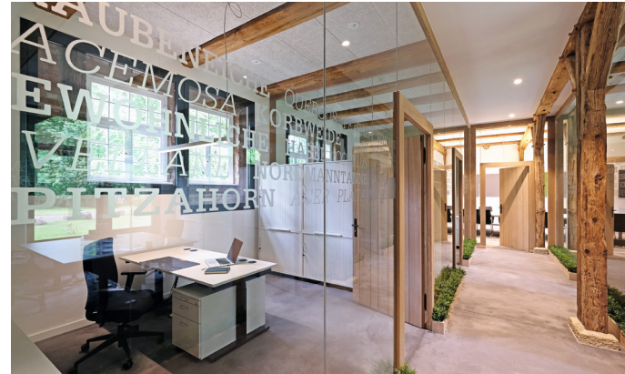
Gutshof Wense, Umbau eines Pferdestalls zum Bürogebäude der Bundesforst